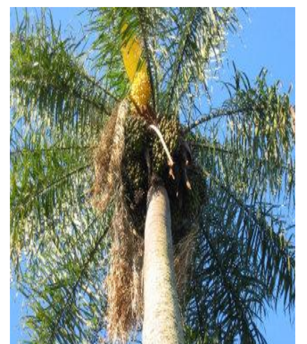
Fig. 04. Planta de A. aculeata .

El mesocarpo presentó un porcentaje medio de 32,94% de lípidos, con un mínimo de 24,21% y un máximo de 50,43%. El endosperma presentó 58,33% de lípidos, con variaciones de 41% a 71%.