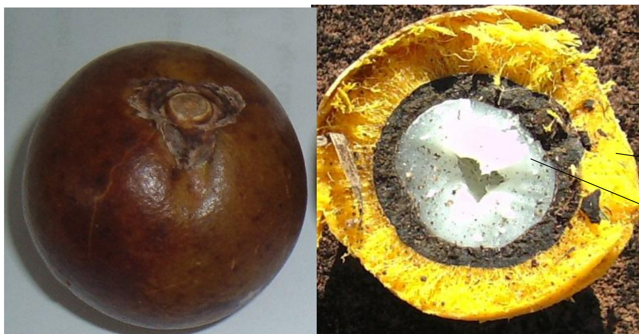
Fig. 01. Fruto de A. aculeata